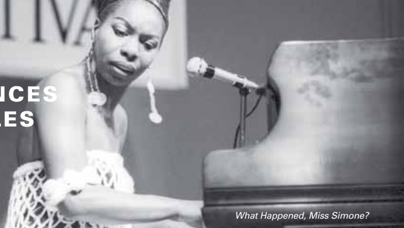
What Happened, Miss Simone?

La section ITINÉRANCES MUSICALES mêle parcours de femmes et créativité musicale. En passant par les grandes chanteuses engagées jusqu'aux questions de genre posées par la place des femmes chefs d'orchestre et compositrices, le parcours emprunte toutes les routes possibles de la création musicale.