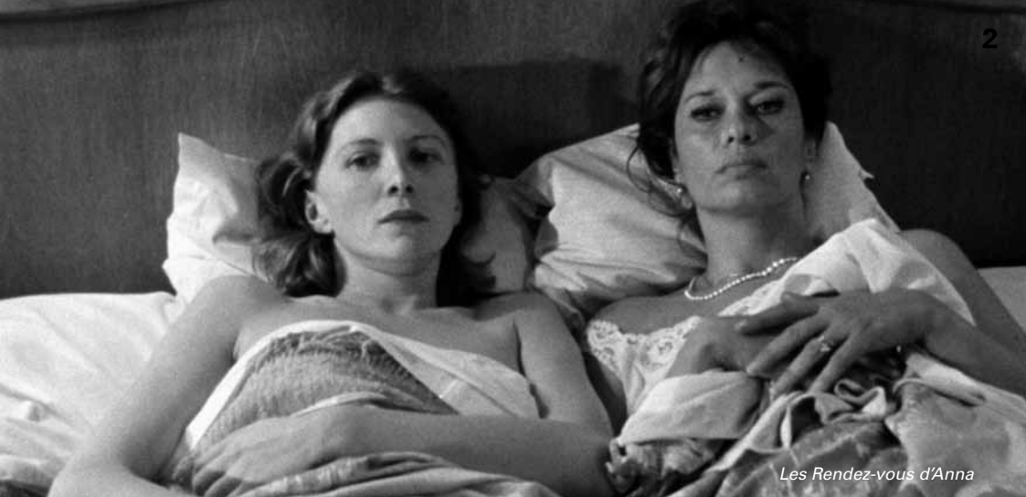
Les Rendez-vous d'Anna