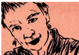
Heart of a Dog