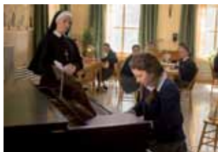
La Passion d'Augustine