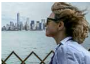
I don't belong anywhere