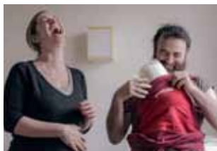
Olmo et La Mouette