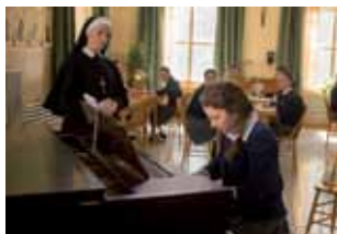
La Passion d'Augustine