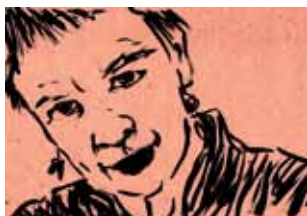
Heart of a Dog